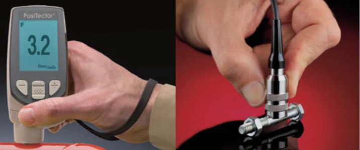
测量各种金属上油漆, 粉末涂层厚度