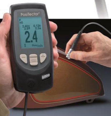
标准型带减震保护套 统计模式下